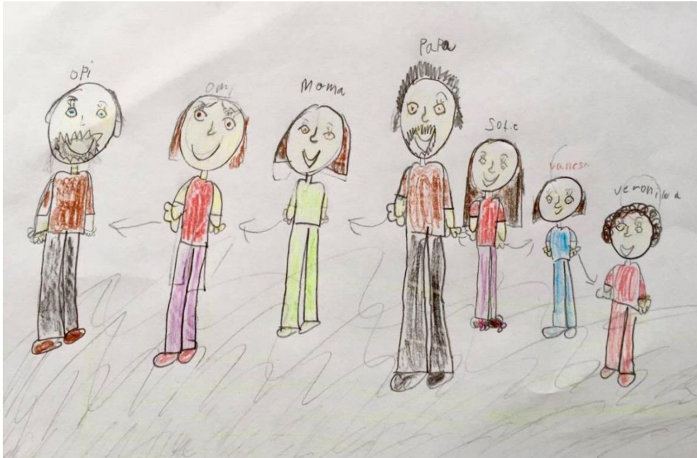
GREGERSENFJÖLSKYLDAN: TEIKNING EFTIR SOFIE GREGERSEN