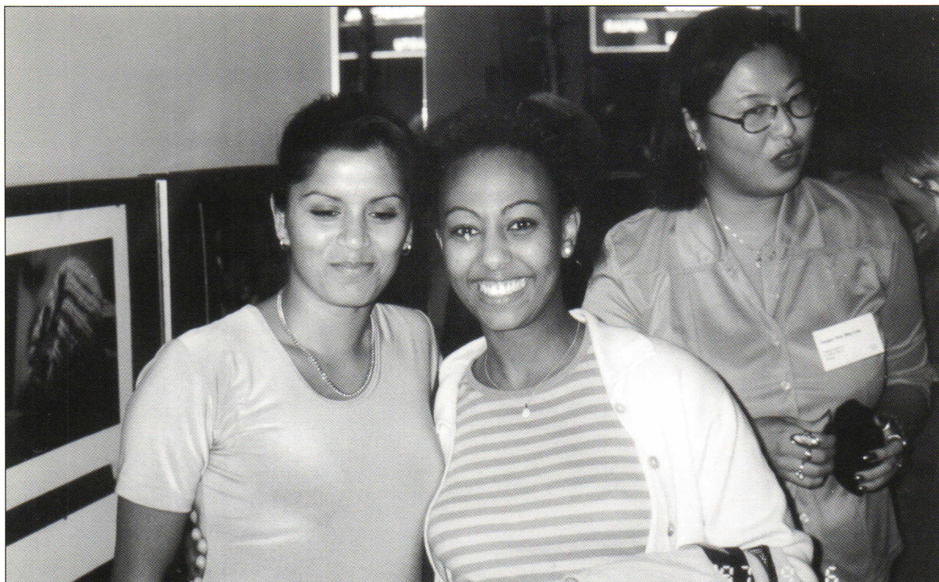
Hressar stelpur á aðalfundi norrænu félaganna í VAASA, Finnlandi sept. '97.